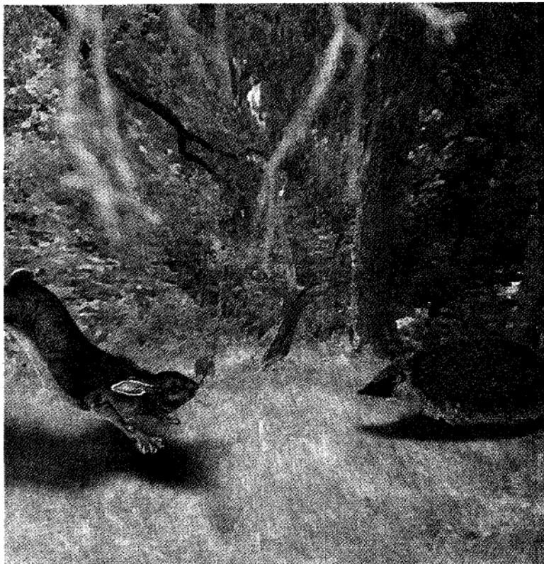
Versucht die Waadtländer Untersuchungsrichterin Françoise Dessaux ihre Verfügungsstrategie durchzusetzen, dürfte sie bald einmal als entkräfteter Hase enden.

Lieferschein Nr.: 1639936 Medien Nr.: 1511 Medienausgabe Nr.: 705152 Objekt Nr.: 8502451 Subobjekt Nr.: 2 Lektoren Nr.: 21 Abo Nr.: 1051017 Teiler Nr.: 11837450